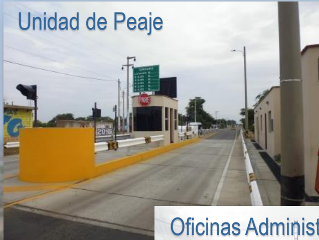
Unidad de Peaje